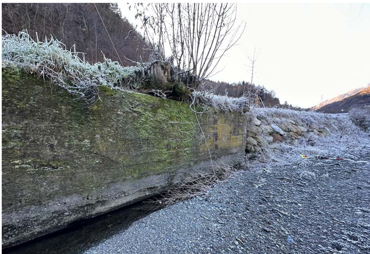
Figura 6 Muro d'argine destro verso monte (in c.a. non rivestito) da demolire e sostituire con una scogliera